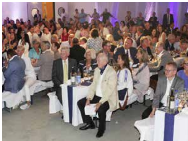
600 guests: business partners and friends of EXTRA Games.