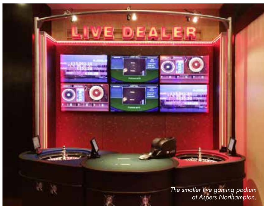
The smaller live gaming podium at Aspers Northampton.

Part of the new cabinet selection includes four NOVOSTAR® V.I.P. II terminals, positioned at the side of the podium with large Illumi-Zone™ wall that creates a stunning gaming environment. This bank of terminals represents a landmark as it is the first time a