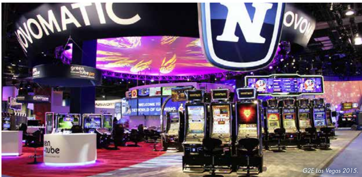
G2E Las Vegas 2015.

Auch die NOVOMATIC Interactive Division verfügt über einen eigenen Bereich auf dem NOVOMATIC-Messestand, um die Online, Mobile und Social Gaming-Innovationen von Greentube und Bluebat zu präsentieren. Und auch NOVOMATIC Lottery Solutions (NLS) und NOVOMATIC Sports Betting Solutions (NSBS) werden auf der G2E ihr komplettes Angebot an Omni-Channel-Lösungen für anspruchsvolle Betreiber in der Lotterie- und Sportwetten-Industrie zeigen. ■