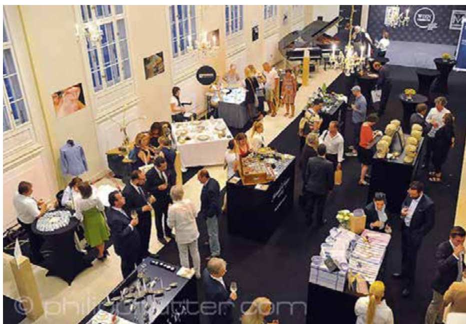
The exhibition ‘Masterpiece Collection’ at the Novomatic Forum, Vienna.

Another special installation was the ‘Masterpiece Atelier’ on the topic ‘Selected national and international handicrafts’. Manufacturers like the soap producer Wiener Seife, camera company Leica Camera, the family business Steiner 1888, the Vorarlberg-based distillery Thomas Prinz and stove-fitter Hallach provided live presentations of their crafts in the form of working ateliers. ■