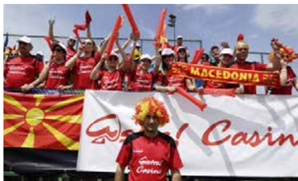
NOVOMATIC Football Tournament 2016.

All participants were welcomed to a gala dinner to kick off the evening’s events that followed. In his opening speech, NOVOMATIC