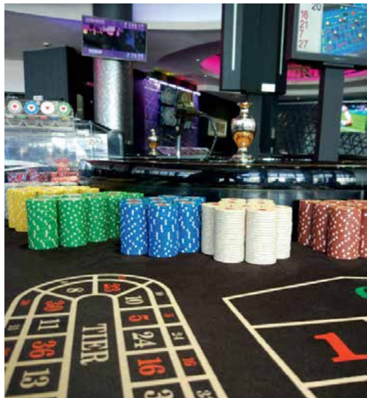
Live Box installation at Casino ADMIRAL Gibraltar.

Built in HTML5, the online game is optimized for a range of desktop, mobile and tablet devices. It also offers operators the ability to display the stream on TV screens so that it can be broadcast across multiple venues and linked to terminals and tablet devices, and all in a seamless HD experience that meets high player standards.