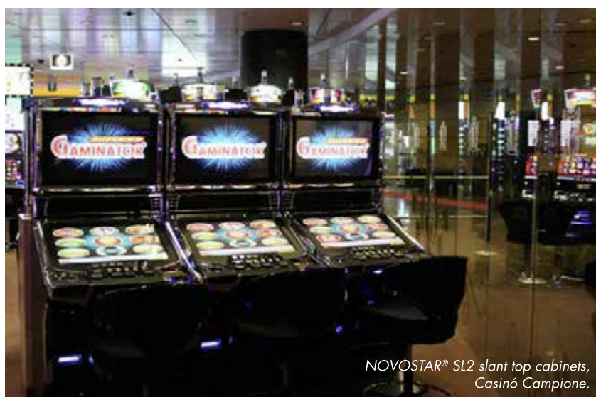
NOVOSTAR® SL2 slant top cabinets, Casinó Campione.

Guests can now watch the events and relax on the comfortable sofas or enjoy the thrills of betting via the bank of self-service sports betting terminals (SSBTs). Their triple-monitor layout guarantees a full information display including betting options, live odds and live broadcast at the machine. Especially during the EURO 2016 matches, the sports betting area