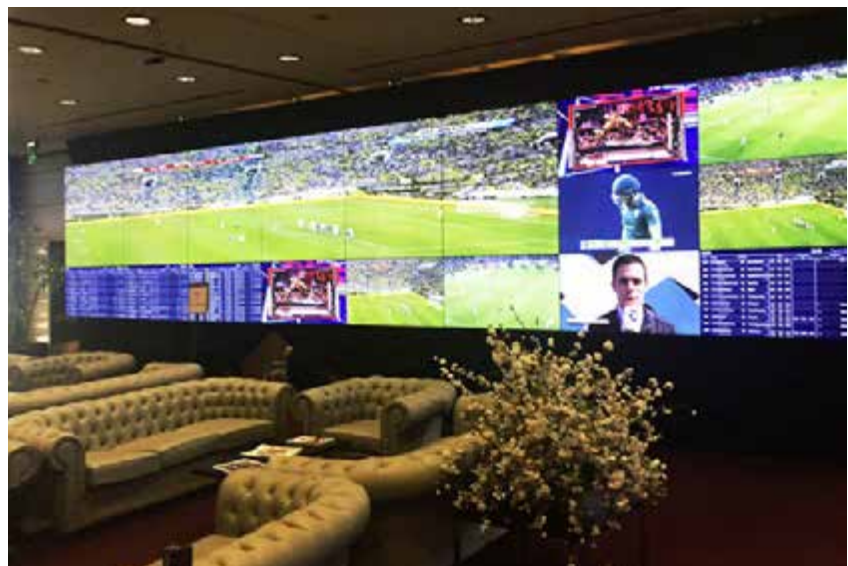
Top: Casinó Campione's 3x8-screen video wall based on NOVOMATIC's Absolute Vision™ display solution. Below: self-service sports betting terminals (SSBTs).