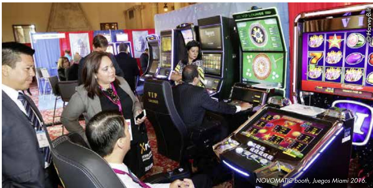
NOVOMATIC booth, Juegos Miami 2016.