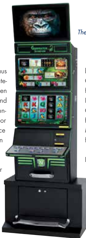
The new GAMINATOR® Scorpion.

Unter den führenden NOVOMATIC-Produkten, die bei dem Event gezeigt wurden, war auch der GAMINATOR® Scorpion, der seine Premiere bei der diesjährigen ICE gefeiert hat. Gemäß dem