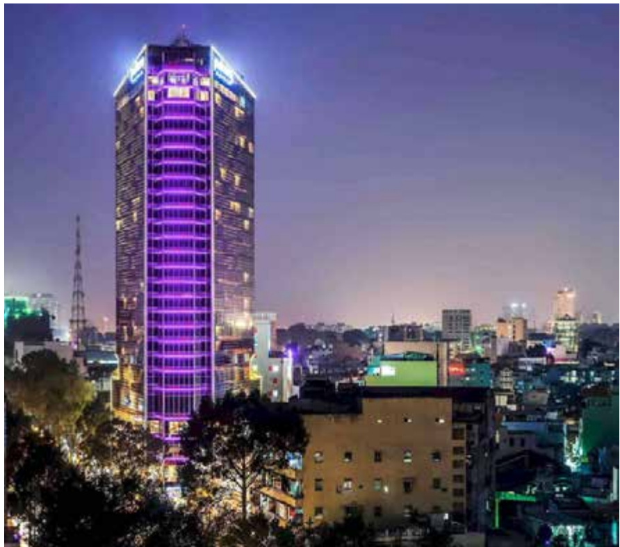
Pullman Hotel Casino in Ho Chi Minh City.

The first V.I.P. Lounge™ cabinets in Vietnam also launched at the Sunset Casino. Unveiled for the first time to the international market earlier this year, this space-optimized V.I.P. cabinet is proving extremely popular with casinos looking to offer their players the NOVOMATIC V.I.P. experience but with limited space on their casino floor.