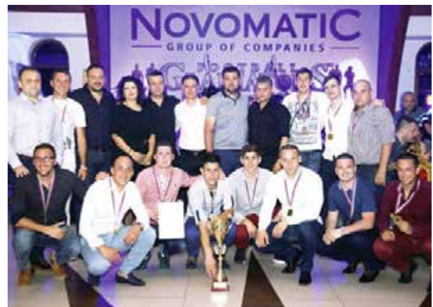
The winning team of the NOVOMATIC football tournament 2016.

Selbstverständlich soll diese gemeinschaftliche NOVOMATIC-Tradition beibehalten werden und mit weiteren jährlichen Turnieren ihre Fortsetzung finden. ■