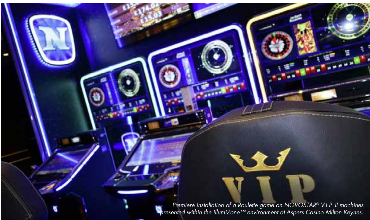
Premiere installation of a Roulette game on NOVOSTAR® V.I.P. II machines presented within the illumiZone™ environment at Aspers Casino Milton Keynes.