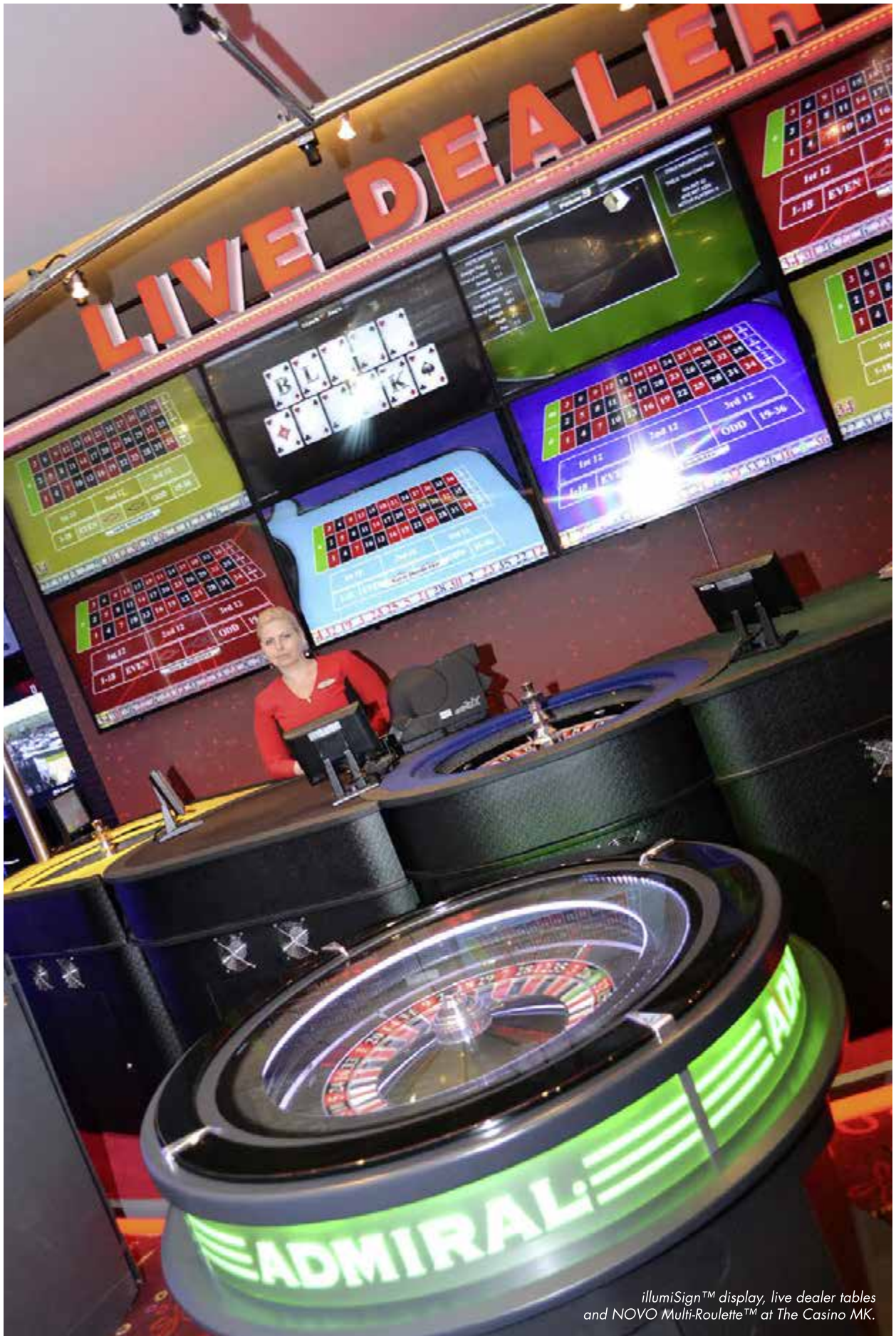
illumiSign™ display, live dealer tables and NOVO Multi-Roulette™ at The Casino MK.