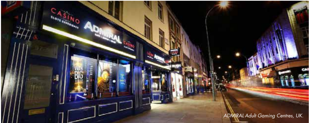
ADMIRAL Adult Gaming Centres, UK.