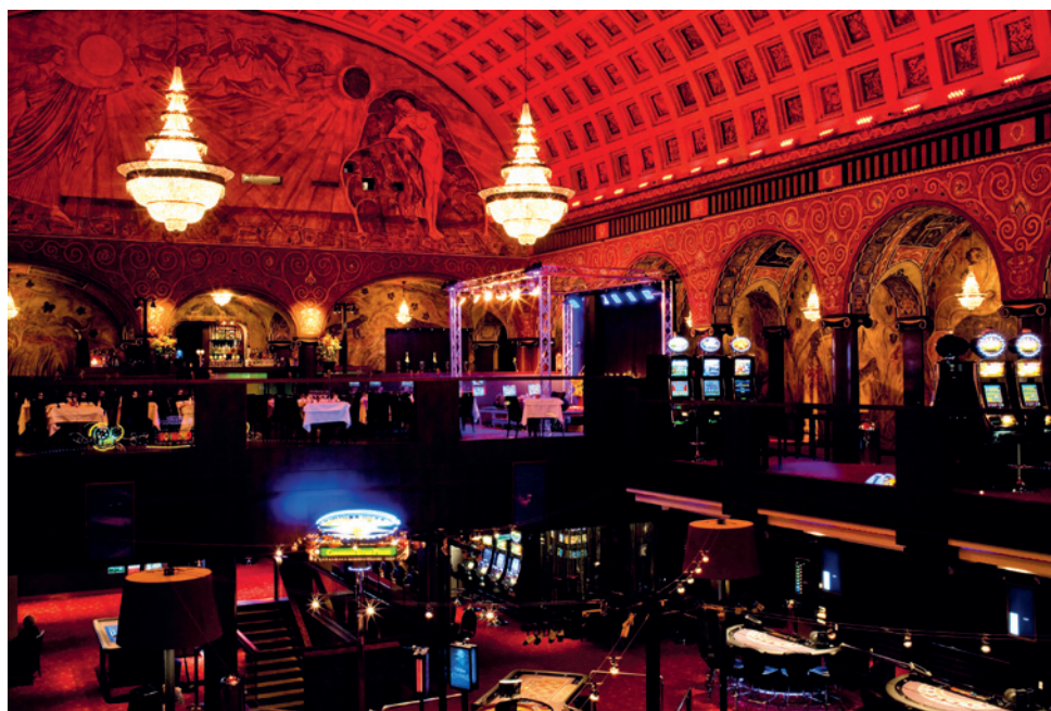
Casino Cosmopol Stockholm.