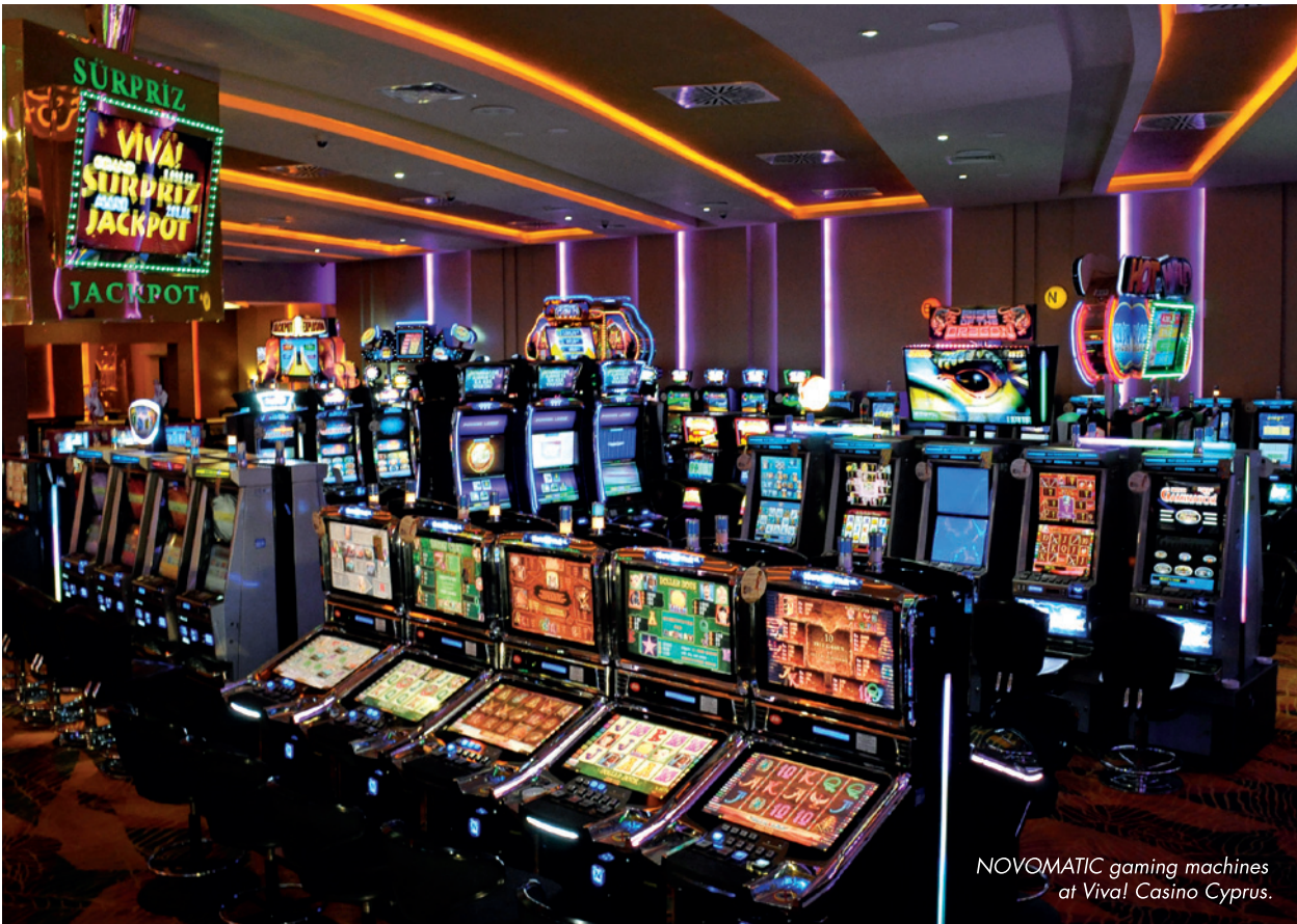
NOVOMATIC gaming machines at Viva! Casino Cyprus.