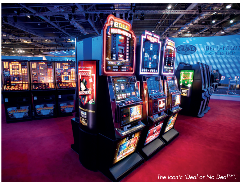
The iconic 'Deal or No Deal'™.

Ein £100-Gewinn wäre überaus positiv für den Cat C Hi-Tec/Pub-Sektor. Wir sind schon gespannt, was die Design-Teams bei Bell-Fruit für die ersten Modelle vorbereiten. Für den Spielhallensektor hoffen wir, dass die Neuerungen zu Investitionen im Bereich Cat C Lo-Tec führen werden, denn in diesem Bereich wurde seit 2007 kaum investiert. Ähnlich hoffen wir, dass eine wahrscheinliche Erhöhung in der Kategorie B4 auf einen neuen £400-Jackpot einen neuen Appetit in dieser Nischenkategorie bringen wird.“ ■