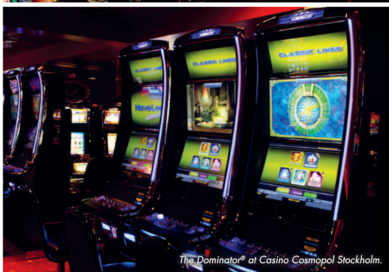
The Dominator® at Casino Cosmopol Stockholm.