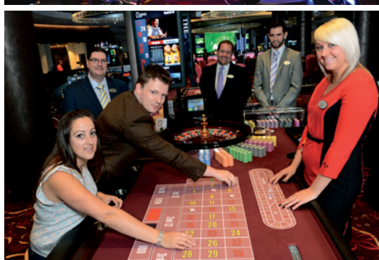
Aspers' Casino Milton Keynes.