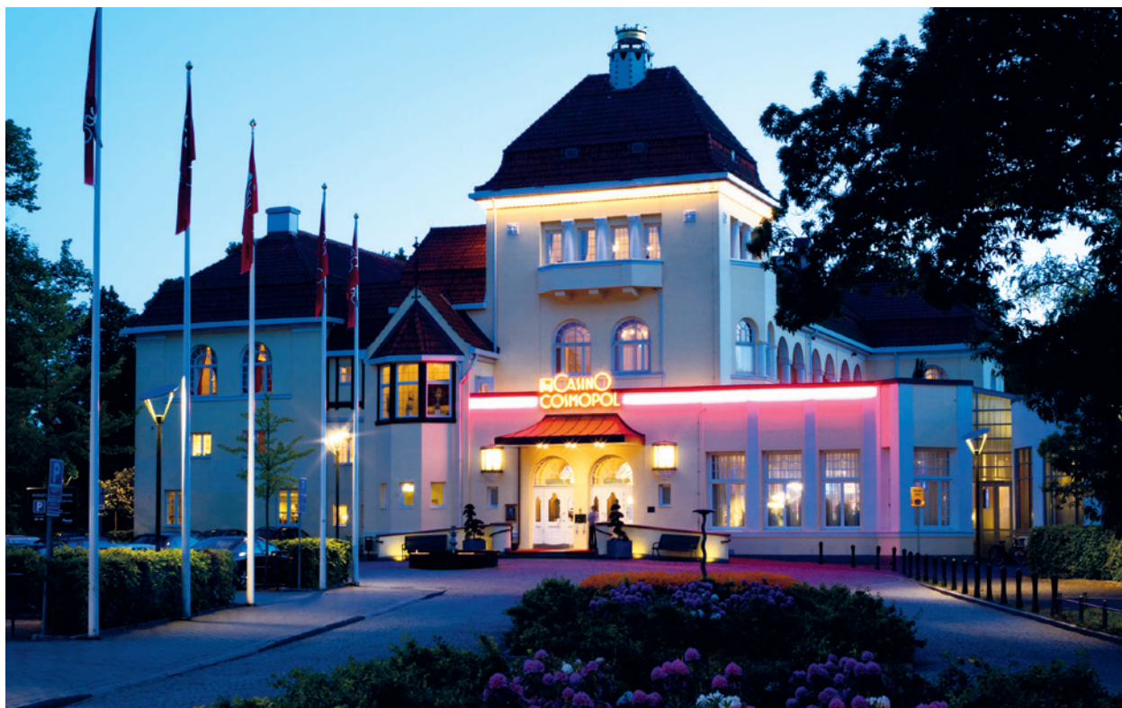
Casino Cosmopol Malmö.