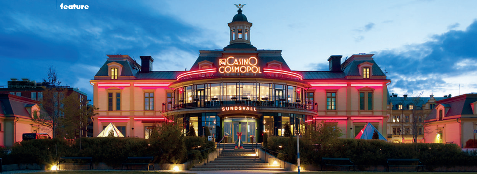
Casino Cosmopol Sundsvall.